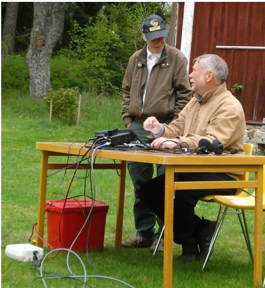
SM5ELV, Kent aktiverade jubileumssignalen SC80SM och avverkade ett stort antal kontakter under dagen.